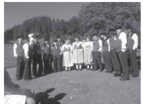
Der Jodlerklub Ägerital begleitete die Feier mit wunderbarem Gesang.